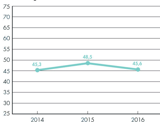
IQs Vardagsindex 2014–2016